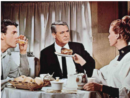
1966 RIEN NE SERT DE COURIR (Walk don't run) de Charles Walters avec Jim Hutton, Cary Grant