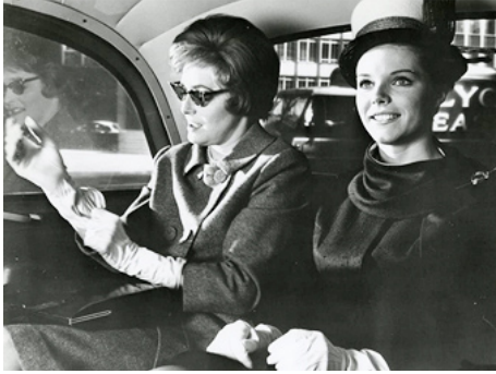
1963 PSYCHÉ 59 (Psyche 59) d'Alexander Singer avec Patricia Neal