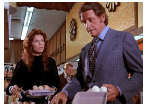
1973 ASSURANCE SUR LA MORT (Double Indemnity) de Jack Smight avec Richard Crenna