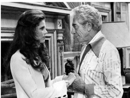
1972 OVERTIME (L'Etrusco uccide ancora) d'Armando Crispino avec John Marley