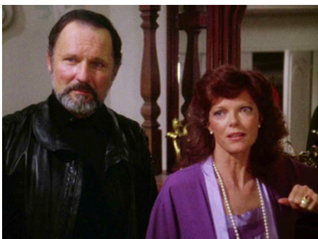
1983 CURTAINS, L'ULTIME CAUCHEMAR (Curtains) de Richard Ciupka avec John Vernon