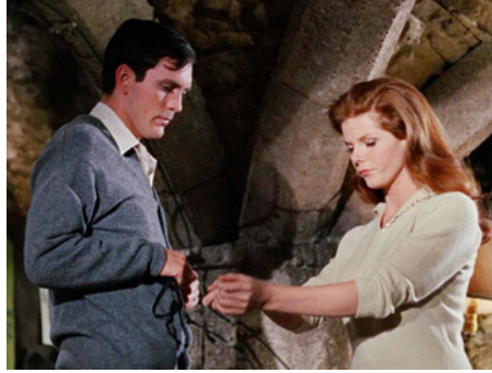
1965 L'OBSÉDÉ (The Collector) de William Wyler avec Terence Stamp