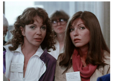
1981 ADORABLES FAUSSAIRES (Hot Touch) de Roger Vadim avec Marie-France Pisier