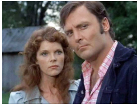
1974 LES INCONNUS DU DÉSERT (All the Kind Strangers) de Burt Kennedy avec Stacy Keach