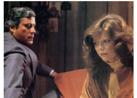
1979 CHROMOSOME 3 (The Brood) de David Cronenberg avec Oliver Reed