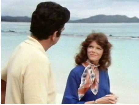
1976 LE TUEUR QUI NE VEUT PAS MOURIR (The Killer who wouldn't die) de William Hale avec Mike Connors