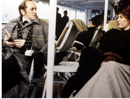
1976 SHERLOCK HOLMES ATTAQUE L'ORIENT-EXPRESS d'Herbert Ross avec Nicol Williamson