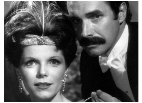
1975 THE LEGENDARY CURSE OF THE HOPE DIAMOND de Delbert Mann avec Bradford Dillman