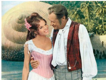
1967 L'EXTRAVAGANT DOCTEUR DOLITTLE (Doctor Dolittle) de Richard Fleischer avec Rex Harrison