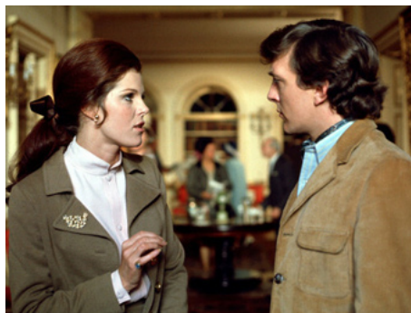
1970 QUI VEUT LA FIN... (The walking Sick) d'Eric Till avec David Hemmings