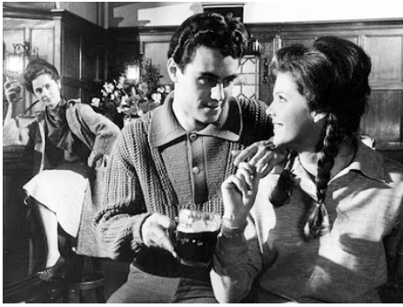
1962 THE WILD AND THE WILLING de Ralph Thomas avec Ian McShane