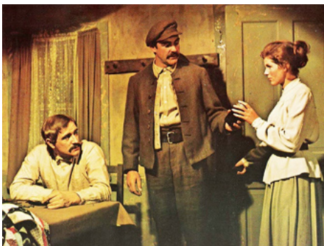
1970 TRÂITRE SUR COMMANDE (The Molly Maguires) de Martin Ritt avec Richard Harris, Sean Connery