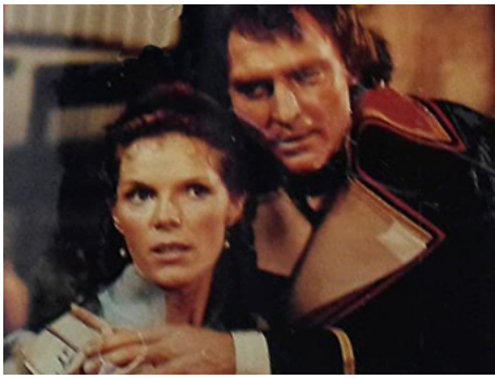
1973 L'HOMME DU DESTIN (The Man of Destiny) de Joseph Hardy avec Stacy Keach