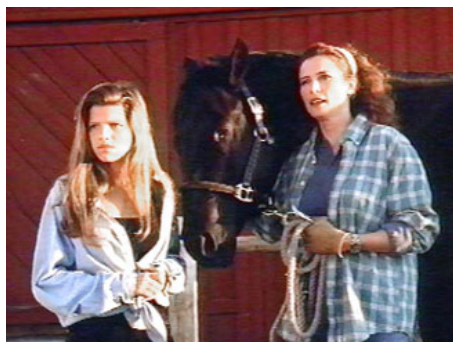
1992 DARK HORSE (Dark Horse) de David Hemmings avec Ari Meyers