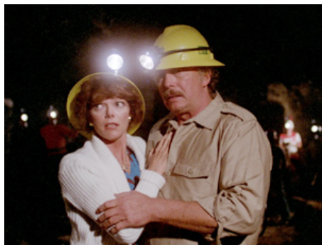
1981 LES DOIGTS DU DIABLE (Demonoid, messenger of Death) d'Alfredo Zacarias avec Roy Jenson