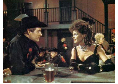
1977 BIENVENUE À LA CITÉ SANGLANTE (Welcome to Blood City) de Peter Sasaki avec Keir Dullea