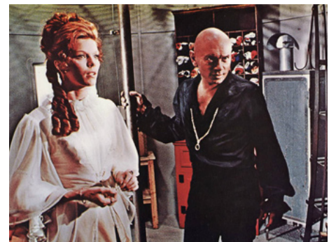
1971 LE PHARE DU BOUT DU MONDE (The Light at the Edge of the World) de K. Billington avec Yul Brynner