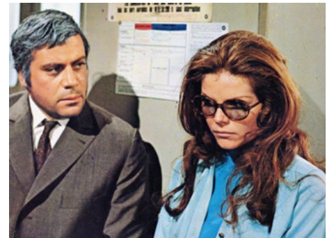
1970 LA DAME DANS L'AUTO... (The Lady in the Car with Glasses and a Gun) d'A. Litvak avec Oliver Reed