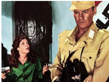
1978 LA GRANDE BATAILLE (Il grande Attacco) d'Umberto Lenzi avec Helmut Berger