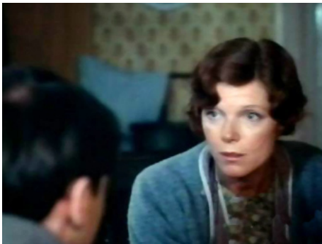
1977 PITIÉ POUR LE PROF (Why shoot the Teacher ?) de Silvio Narizzano