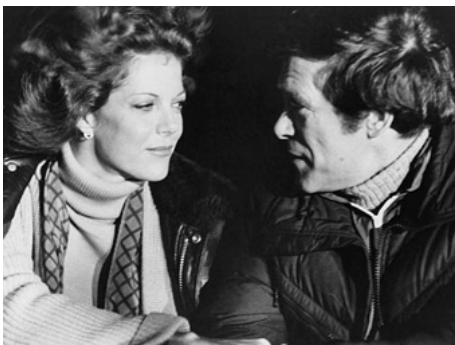
1980 LE DROIT DE TUER (The Exterminator) de James Glickenhaus avec Christopher George