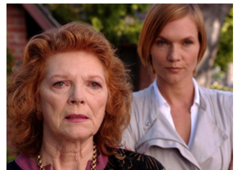
2011 THE NINE LIVES OF CHLOE KING de Dan Berensen avec Jolene Andersen