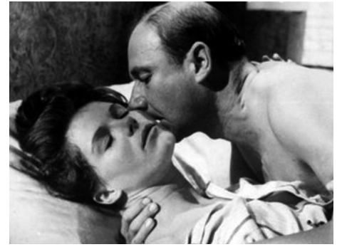
1963 DOCTEUR CRIPPEN (Dr Crippen) de Robert Lynn avec Donald Pleasence