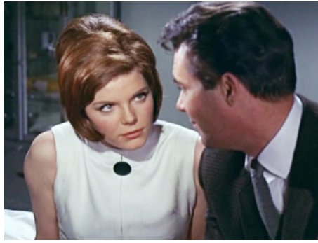
1963 DOCTEUR EN DÉTRESSE (Doctor in Distress) de Ralph Thomas avec Dirk Bogarde